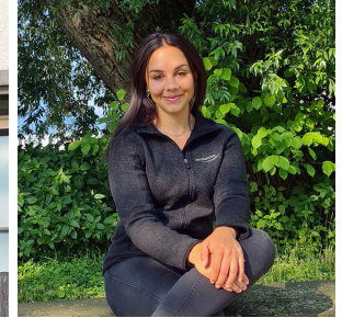
Rosina Dürr Verdunova AG