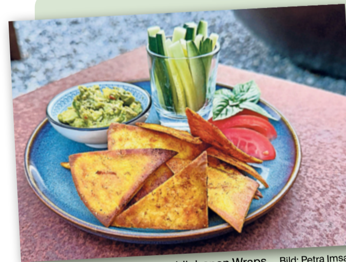
Feine Chips aus übrig gebliebenen Wraps.

«Bezüglich Tellerrücklauf konnten massive Einsparungen gemacht werden. Ein Teil des eingesparten Geldes ging in die Mitarbeiterkasse. Die Leistung des Teams wurde belohnt, das hat uns sehr beeindruckt. Die Differenz zwischen der Ist-Messung zu Beginn des Projekts und der Erfolgsmessung betrug minus 245 Kilogramm Foodwaste pro Monat und über 1000 Franken eingesparte Warenkosten pro Monat. Neben der Sensibilisierung der Mitarbeitenden brauche es aber auch das Verständnis der Gäste. «Ohne den Gast geht es nicht. Er muss in den Prozess einbezogen werden», so Pabst. (ip)