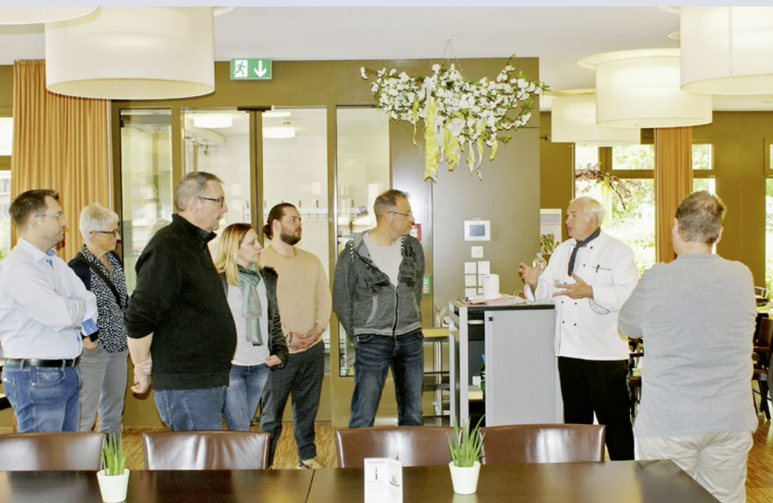
Im Alterszentrum Dorflinde fand der Workshop «Ohne Kommunikation kein Food Save» statt.

Im Fokus standen aber nicht nur die Erlebnisse der Betriebe, sondern auch der Erfahrungsaustausch mit den motivierten Teilnehmenden. So erfuhren Organisatoren wie auch Besucher spannende neue Impulse und konnten sich im Kontext der Food-Save-Bewegung vernetzen und wertvolle Kontakte knüpfen. Damit die Veranstaltungsserie nachhaltig in Erinnerung bleibt, durften die Teilnehmenden auch physisch etwas mit nach Hause nehmen. Ein Kartendeck mit 32 konkreten Ideen und Anstössen, wie Food Waste im eigenen Betrieb adressiert werden kann. Nun stellt sich aber die Frage, ob tatsächlich eine nachhaltige Wirkung der Veranstaltungsserie erzielt werden konnte. Dazu wurden Stimmen von Teilnehmenden, Kursleitern und Organisatoren eingefangen.