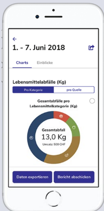
Die Waste-Tracker-App unterstützt das Küchenteam bei der Erhebung der Lebensmittelabfälle.

Die Stimmen der Teilnehmenden und Organisatoren machen deutlich: Die Motivation