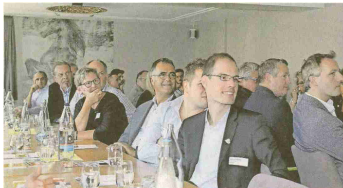
Interessierte Mitglieder und Gäste

sibilisieren» heisst eines der Zauberworte: In einem ersten Schritt kann tagtäglich ein Auge darauf geworfen werden, was im Abfalleimer landet. Und dazu gilt es, das ganze Team einzubinden. Wer Waren einkauft bezahlt sie – wer sie nicht verkauft, zahlt grad dreifach: Einkauf – Herstellung – Entsorgung. Im Schnitt kostet 1 Kilogramm «Speiseabfall» locker 24 Franken – wenn das nicht zum Nachdenken animiert? Das verlorene Potenzial kann gewinnbrin-